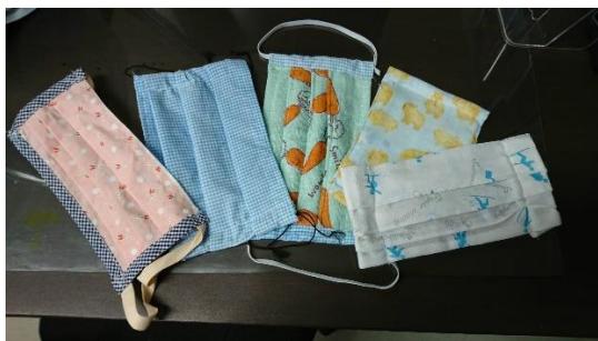
社長手作りマスク 色々 20枚作りました ゴム紐が手に入らず紐・ヘアゴムで代用してます

通勤と事務所内使用のマスク別けてください事務所から一日2枚（訪問非常勤者 半日1枚）を支給制にします。事務所内使用マスクは手造りを支給します。又は簡易紙タオルマスクご協力して下さい